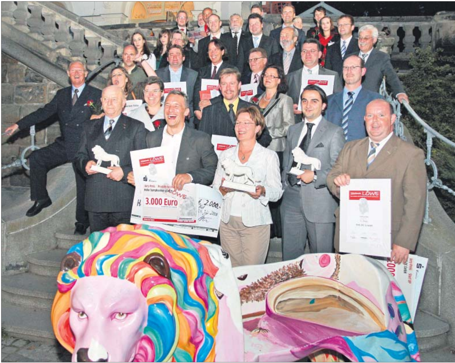
Stolze Sieger: Innovative Unternehmen aus der Region wurden am Donnerstag mit dem Mittelstandslöwen ausgezeichnet.

Der direkte Draht zur Redaktion der regionalen Wirtschaftsseite: Dieter Weigel, Telefon 09281/816239 Matthias Will, Telefon 09281/816207 E-Mail: wirtsch@frankenpost.de